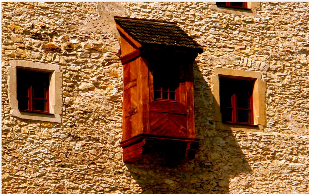
Jura Krakowsko – Częstochowska. Zamek w Bobolicach.

Proszę sobie tylko wyobrazić jakie było moje zdumienie w trakcie utrwalania zdjęć, gdy nagle na jednym z podwórek przy Placu Konstantego Ćwierka ujrzałem prawie identyczne drewniane zabudowanie jak w Zamku w Bobolicach. A były nimi zawieszane na elewacji kamienicy nie jedna, ale dwie drewniane kabiny. Byłem wówczas tym widokiem niezmiernie zaskoczony, gdyż czegoś takiego nie spodziewałem się zobaczyć na własne oczy i to jeszcze w XXI wieku, i to niemal w centrum gwarne go miasta. Przechodzący przez podwórze nieznan mi mężczyzna, oświadczył, że są to dawne jeszcze drewniane ubikacje, zwane popularnie wychodkami i wiszą na tej elewacji kamienicy już od co najmniej kilkunastu lat. Ale obecnie już chyba tylko służą jako dodatkowe pomieszczenia gospodarcze, mieszkającym w tej kamienicy jednemu lub dwóm lokatorom.