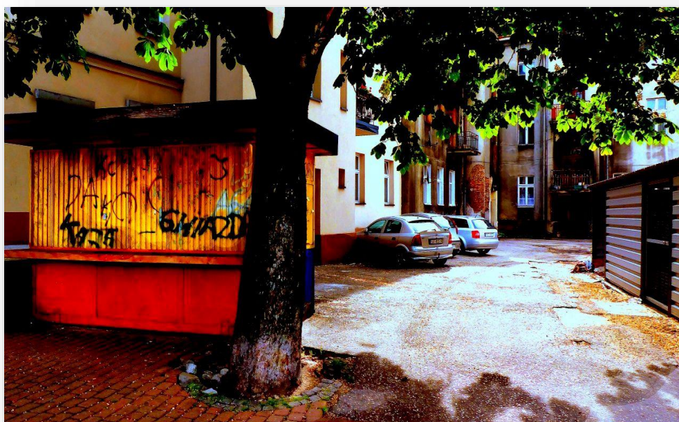
Sosnowiec Plac Konstantego Ćwierka. Wejście do podwórka, gdzie zawieszono na kamienicy drewniane zabudowania.