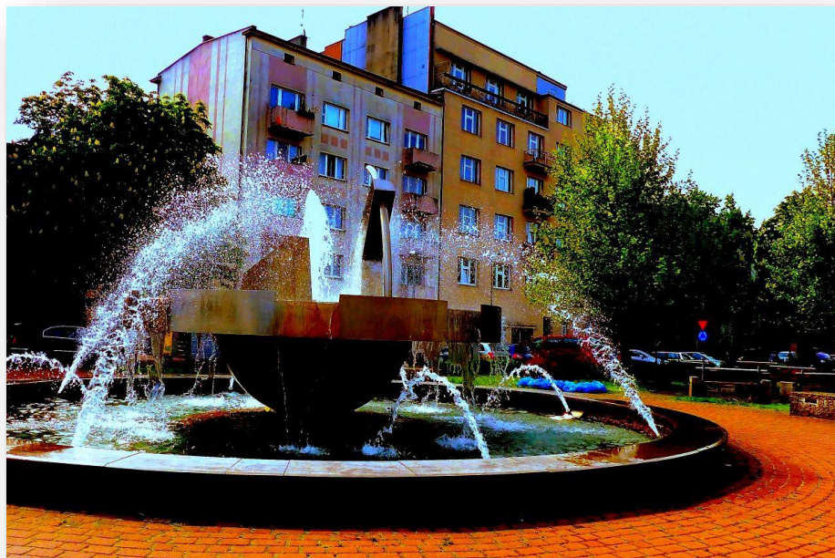
Sosnowiec. Plac Konstantego Ćwierka