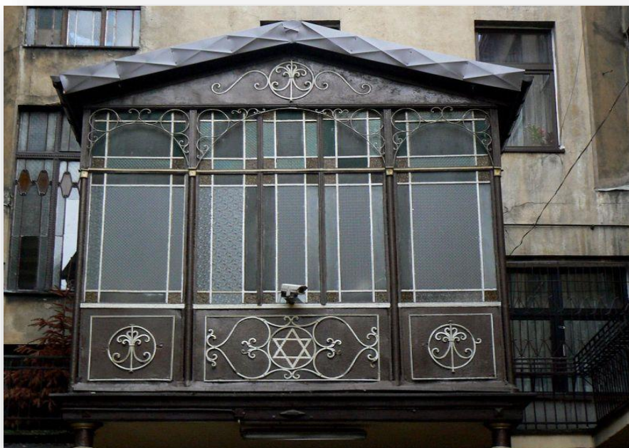
Źródło: Wikipedia A ( z dnia 25.XI.2022r.). Łódź, ul. Piotrkowska 88. Żydowska Kuczka. Praca Jarosława Góralczyka.